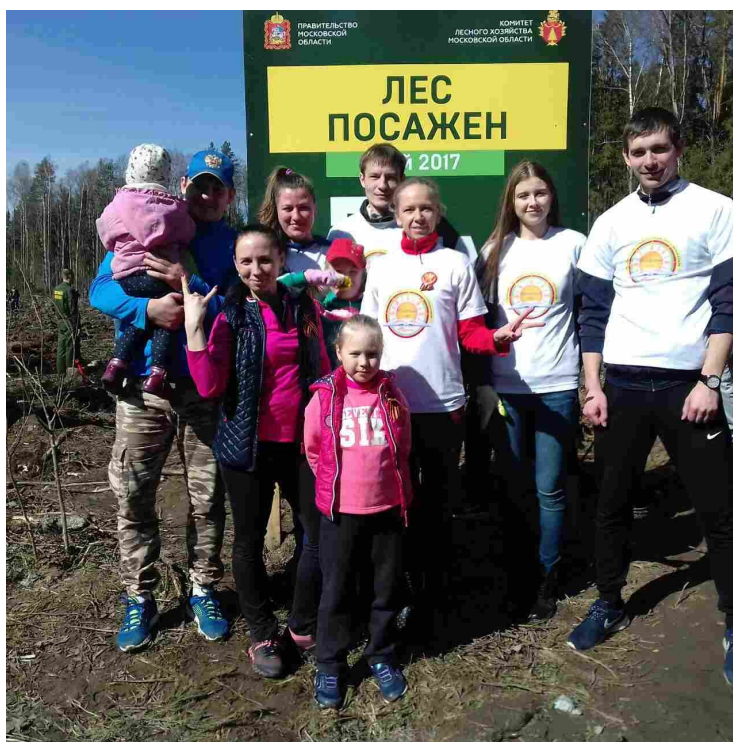
Акция «Посади своё дерево»

Запланировано проведение акции молодежной агитбригадой (правда, выступает она не так часто, как хотелось бы) «Расскажи о профсоюзе!»,