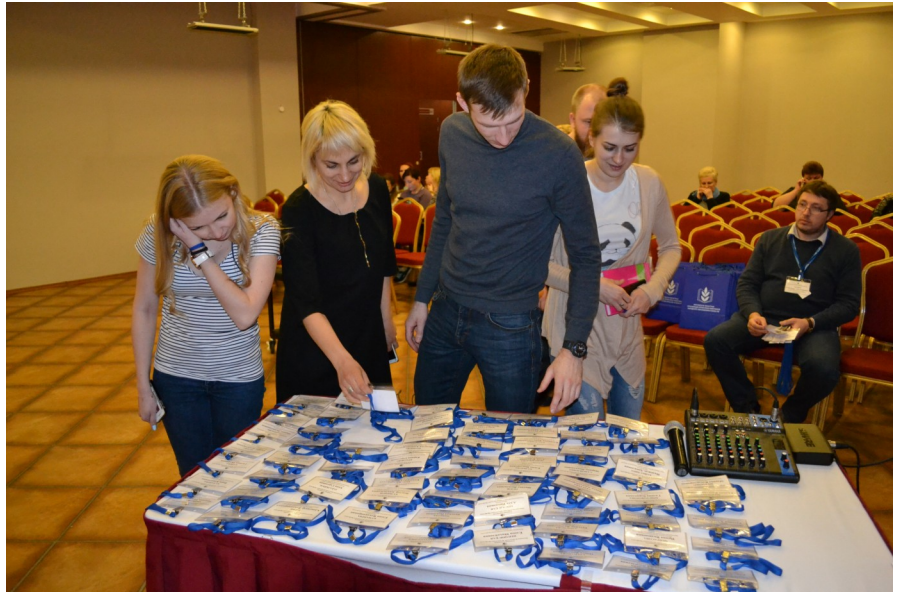
Первое задание семинара: «Найди свой бейдж»