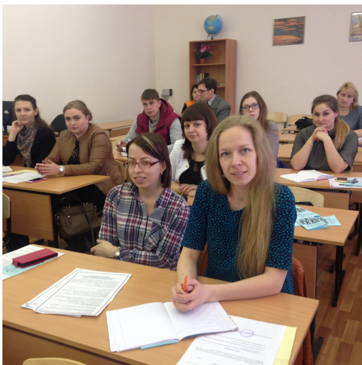
Молодёжный совет Егорьевской районной организации

Отношение к будущему у молодежи выражается в надежде, что жизнь станет лучше, а также уверенностью выстоять в любых условиях.