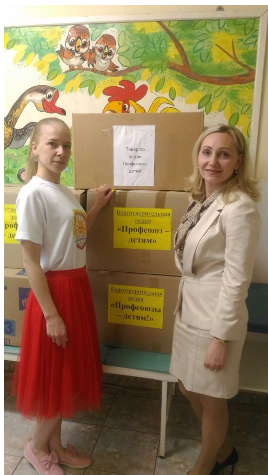
Благотворительная акция «Профсоюз детям»

Молодые специалисты знают о работе профсоюза и считают его нужным обеим сторонам: и работодателю, и работникам.